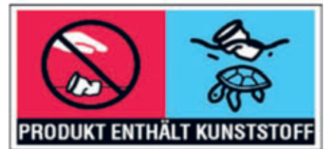
Kennzeichnung für Getränkebecher (Quelle: Durchführungsverordnung (EU) 2020/2151) Quelle: Europäische Kommission

In der Einleitung der EU-Einwegkunststoffrichtlinie ist zu lesen, dass Einweg-Getränkeflaschen aus Kunststoff zu dem an den Stränden der Union am häufigsten vorgefundenen Meeresmüll zählen. Die im Artikel 6 beschlossene Maßnahme, die Verschlüsse und Deckel aus Kunststoff fest mit dem Behälter zu verbinden, soll die Meeresvermüllung reduzieren. So bilden nun Flasche und Deckel eine Einheit und sollen auch nicht mit Gewalt voneinander getrennt werden.