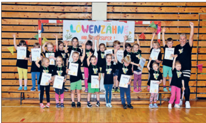
Text und Fotos: Annekathrin Weiß