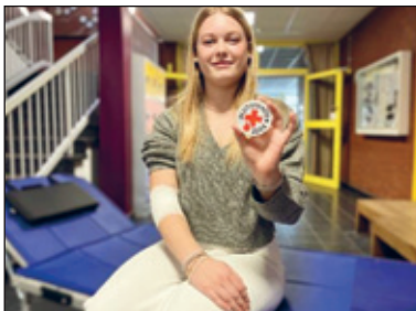
Junge Erstspenderin, die nach ihrer Blutspende die Information über ihre Blutgruppe erhält

Das Wissen um die eigene Blutgruppe spielt vor allem bei Bluttransfusionen eine Rolle. Die Blutgruppen von Spender und Empfänger müssen zueinander passen, ansonsten kann es zu einer Verklumpung des Blutes kommen, die für den Empfänger Lebensgefahr bedeutet. Auch bei einer Schwangerschaft ist es wichtig, die Blutgruppe der Mutter und des Kindes zu kennen. Denn je nach Konstellation kann es zu Unverträglichkeiten zwischen mütterlichem und kindlichem Blut kommen. Vor einer Operation bestimmen medizinische Fachkräfte immer die Blutgruppe des Patienten, wenn eine Bluttransfusion erforderlich sein könnte. Sollte es medizinisch notwendig sein, veranlasst der Haus-