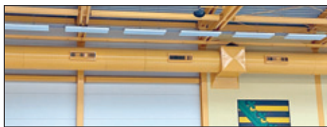
Teil der ursprünglichen Lüftungsanlage

der kommunalen Einrichtung um mindestens 60.000 kWh zu senken. Damit amortisiert sich die Investition in spätestens 9,5 Jahren.