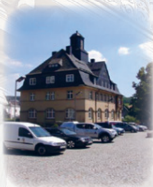
Teststrecke Marktplatz Burkhardtsdorf

Noch im Jahr 2010 erhielt die Gemeinde Burkhardtsdorf einen ersten Zuwendungsbescheid, welcher damals eine Gesamtsumme von 205.432,05 €, davon 154.074,04 € Zuwendung (Förderquote 75 %) auswies.